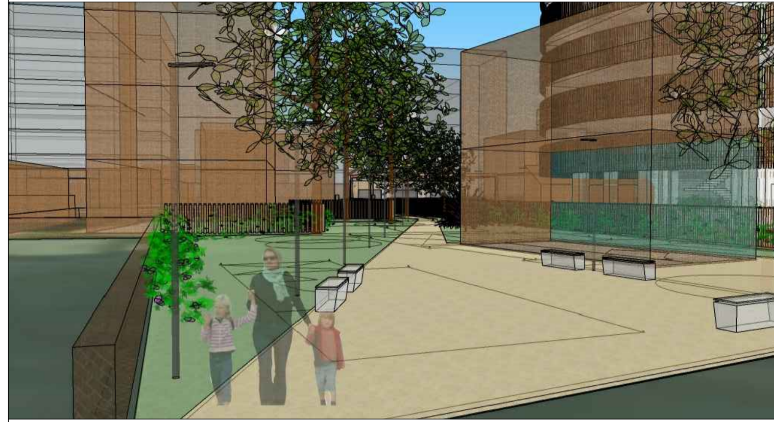
Oggetto: Planovolumetrico di progetto

data consegna: novembre 2021 scala: 1:200 tav.: 7 adottato: D.G.C. N. 267 DEL 08/04/2022 approvato: