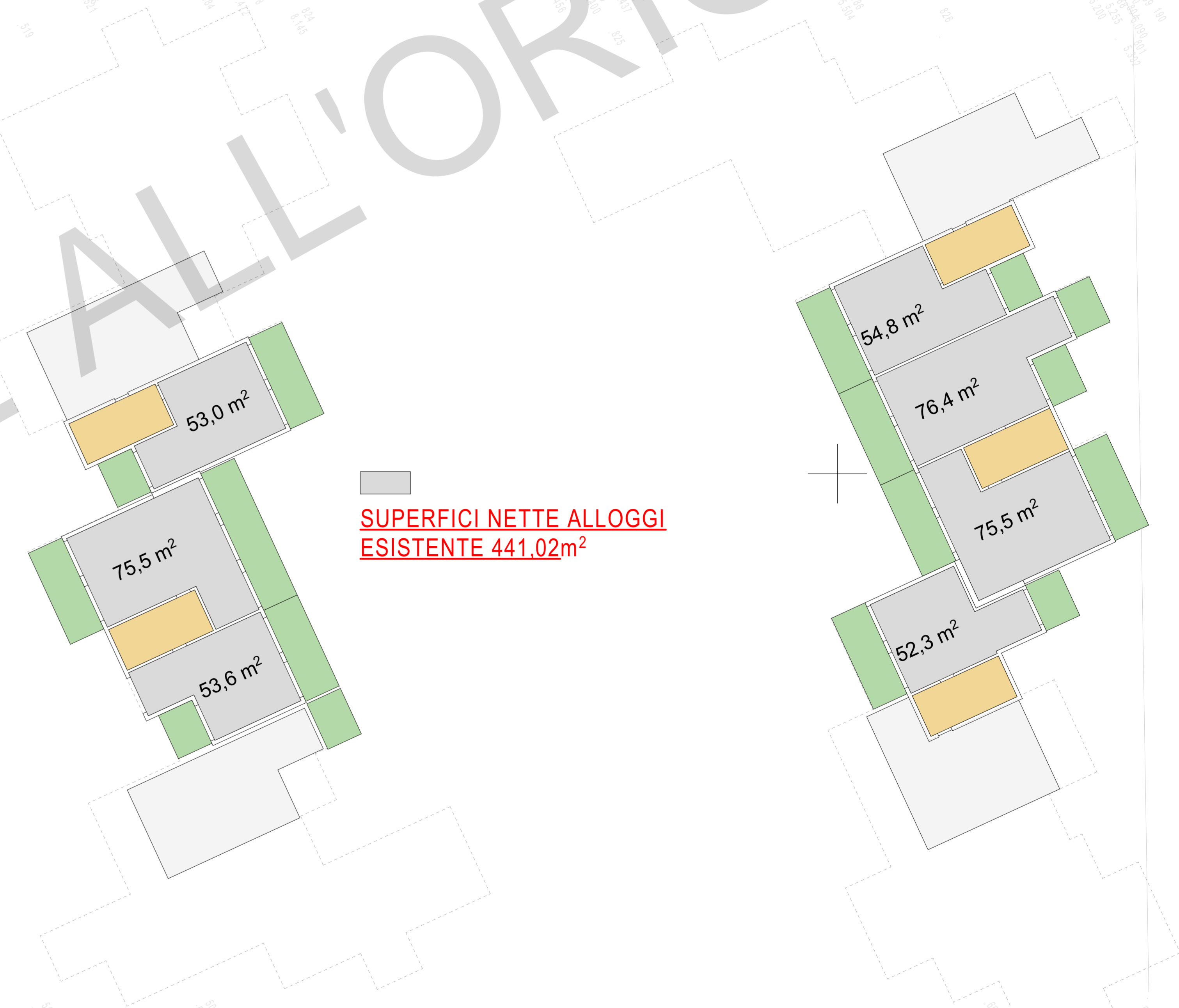
Pinata piano quarto esistente

SUPERFICI NETTE ALLOGGI ESISTENTE 441,02m²