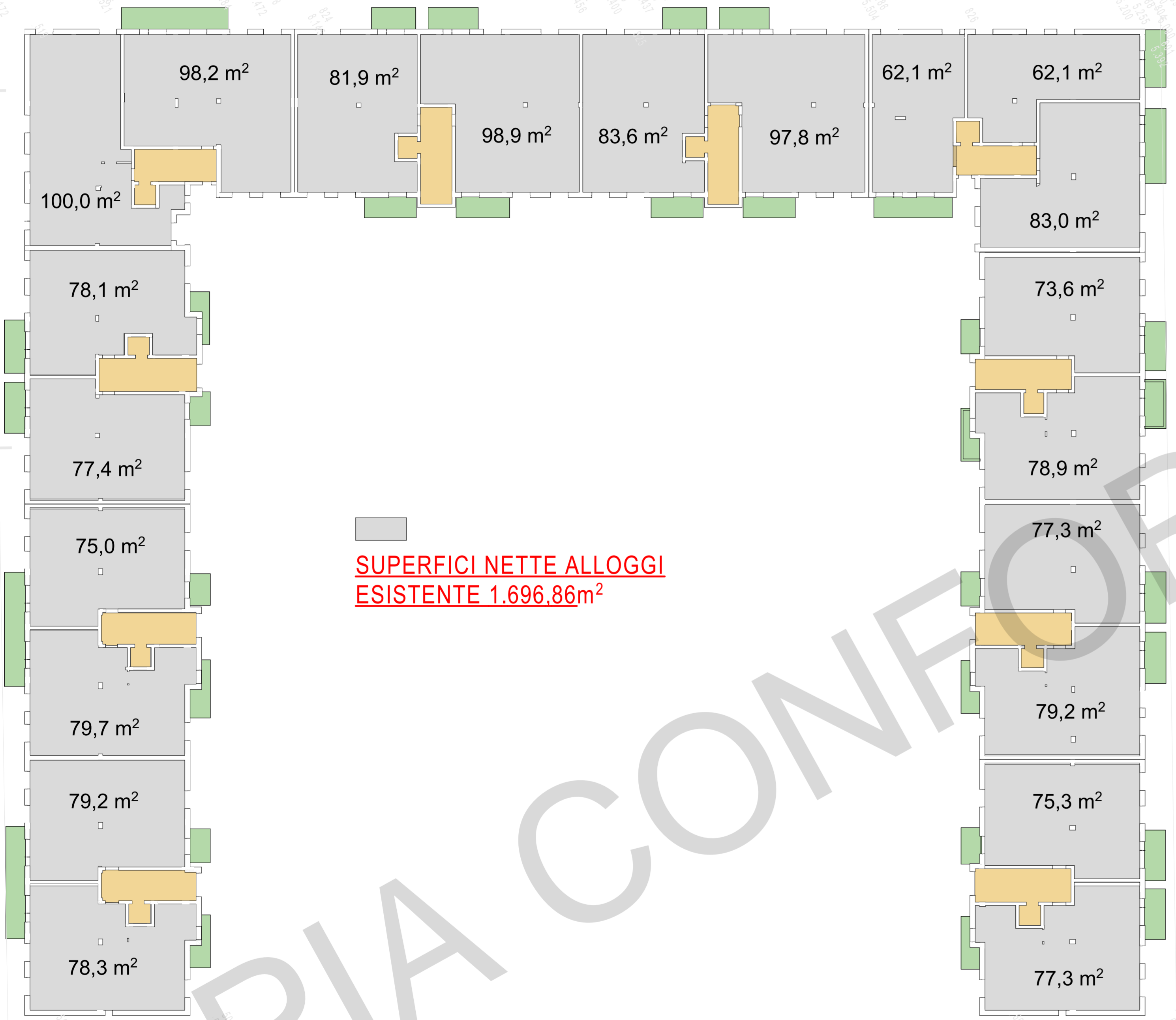
Pinata piano terzo esistente