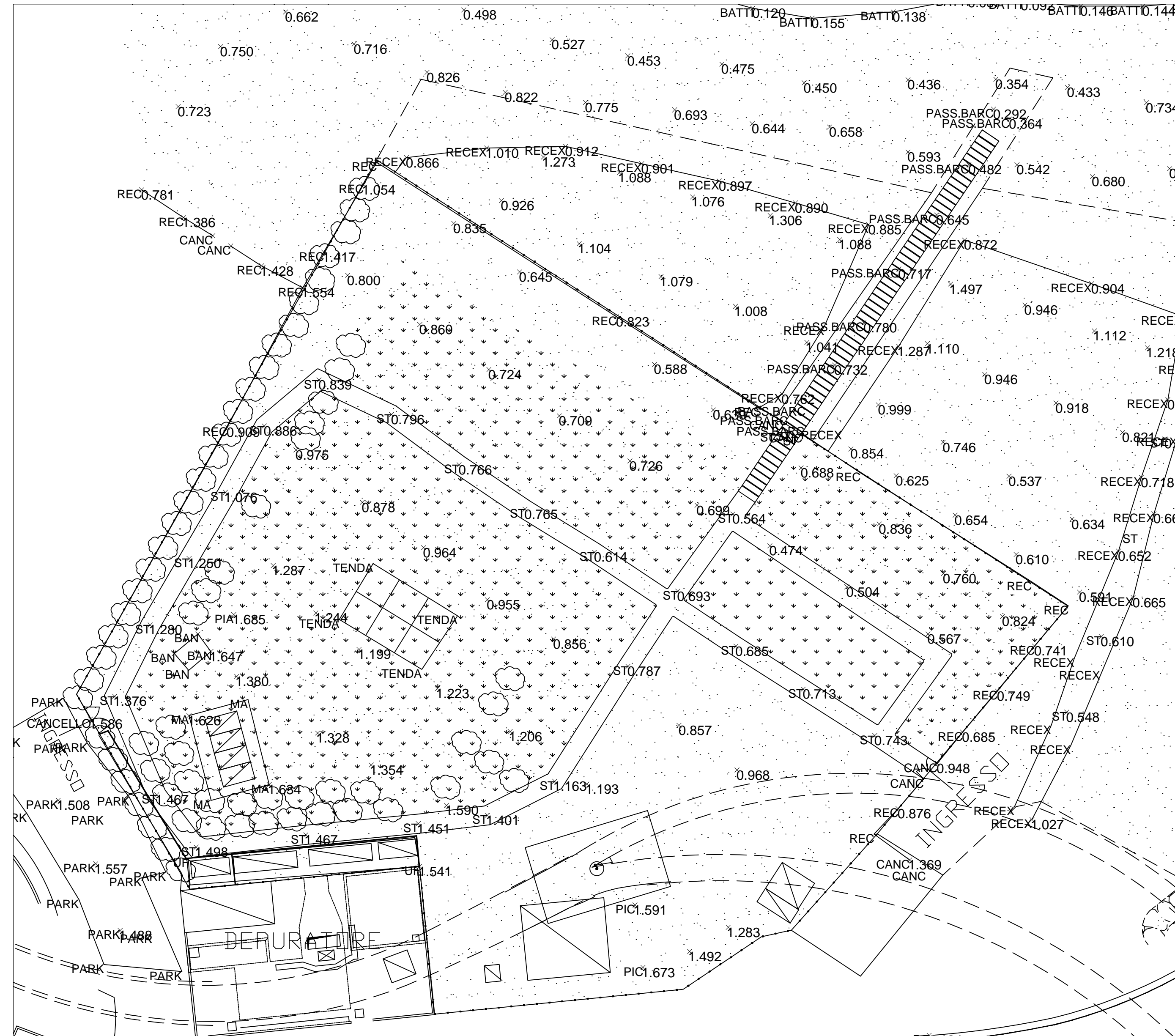
Rilievo altimetrico dello stato di fatto _ scala 1:500