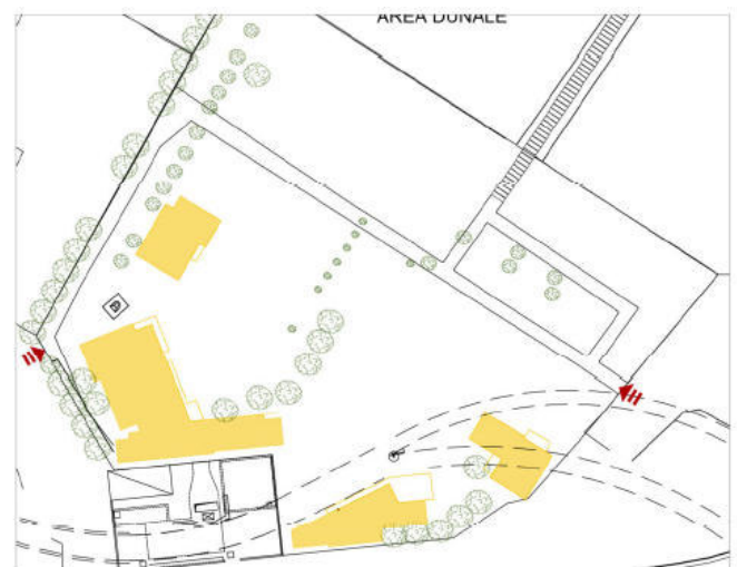
Superficie coperta _ scala 1:1000