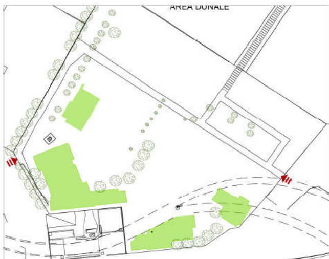
Superficie totale _ scala 1:1000